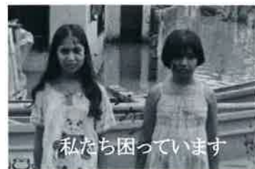
私たちが困っています