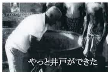
やっと井戸ができた