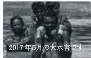
2017年5月の大水害です