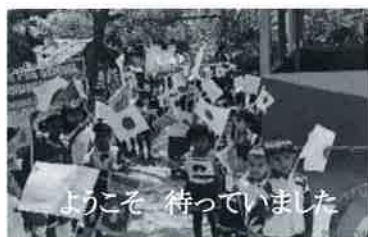
よごそ 待っていました