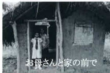
お母さんと家の前で