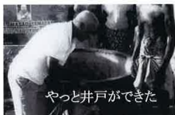
やっと井戸ができた