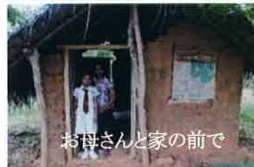
お母さんと家の前で