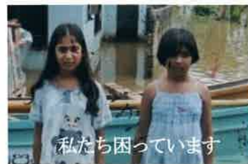
私たち困っています