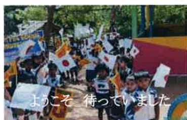
ようこそ 待っていました