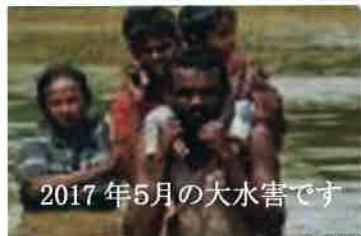
2017年5月の大水害です